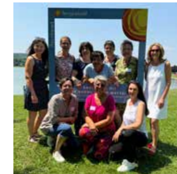
Bürgermeisterinnen aus dem Burgenland

Austragungsort war dieses Jahr im Burgenland, in den Gemeinden Deutsch Kaltenbrunn und Rauchwart. Rund 65 Ortschaftefinnen versammelten sich in den beiden Gemeinden, um sich zu vernetzen und auszutauschen.