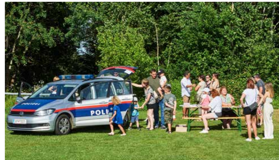
Die Blaulichtorganisationen Feuerwehr, Polizei, Hundestaffel und Rettung präsentierten sich.