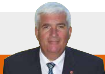
Bürgermeister Manfred Jestl