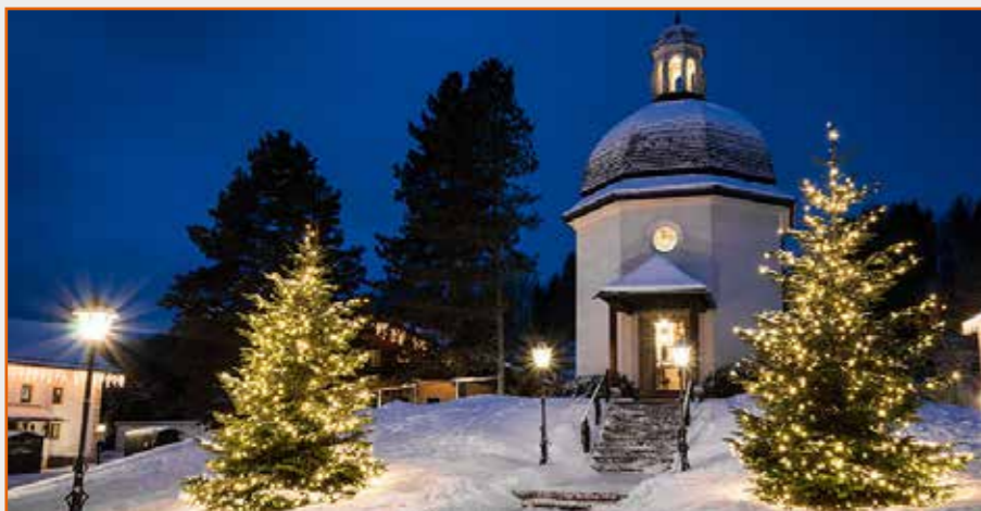
„Stille Nacht Kapelle“ in Oberndorf bei Salzburg